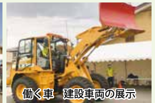
働く車 建設車両の展示