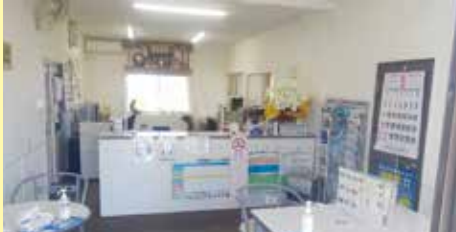
写真は改装した事務所内部です。 被災前よりかなり綺麗になりました。