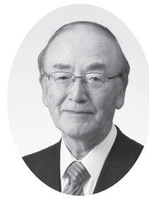
日本商工会議所会頭