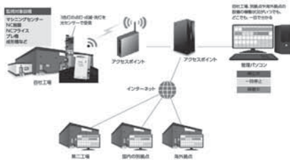
▲はOOKKは機械の稼働を監視するシステム。工場内の稼働はRFIDで、課外の拠点からの情報はインターネット経由で収集できる。飯山精器ではIoTシステム工場の稼働状況も本社で見ることが出来る。

「6年生産から多品種・少量・短納期の仕事に変わった頃の納期短縮率は80%に届きませんでした。IoTを使うようになって、92%・93%まで向上しました。残り