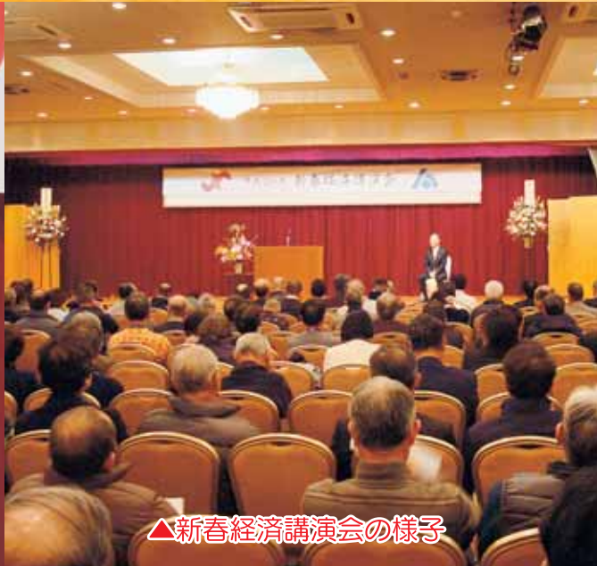
△新春経済講演会の様子