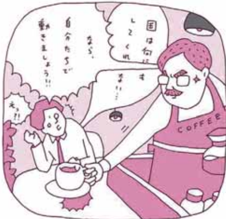
それは「企業と地域の応援団」

商工会議所は、日本の企業と地域を元気にしたいと願う民意の結晶から 生まれた経済団体。国や自治体につくられた機関ではありません。 きょうも全国515の会議所が、 日本経済の明日を拓くための取り組みを続けています。