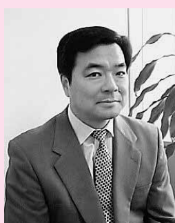
高橋 進/たかはし・すすむ

1953年生まれ。一橋大学経済学部卒業後、住友銀行（現三井住友銀行）に入行。90年日本総合研究所調査部主任研究員へ。調査部長、理事を歴任後、2005年～07年まで内閣府政策統括官（経済財政分析担当）として、月々の景気判断、内外経済動向の分析、経済財政政策に関わる調査などを行った。07年8月、日本総研へ副理事長として復帰、11年6月には理事長に就任。また、現在、第2次安倍内閣の発足に伴い、経済財政諮問会議および一億総活躍国民会議の民間議員を務めている。テレビ東京「ワールドビジネスサテライト」やフジテレビ「新報道2001」などの経済情報番組にも出演。