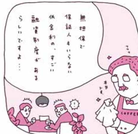
それは「マル経融資」

商工会議所は、日本の企業と地域を元気にしたいと願う民意の結晶から 生まれた経済団体。国や自治体につくられた機関ではありません。 きょうも全国515の会議所が、 日本経済の明日を拓くための取り組みを続けています。