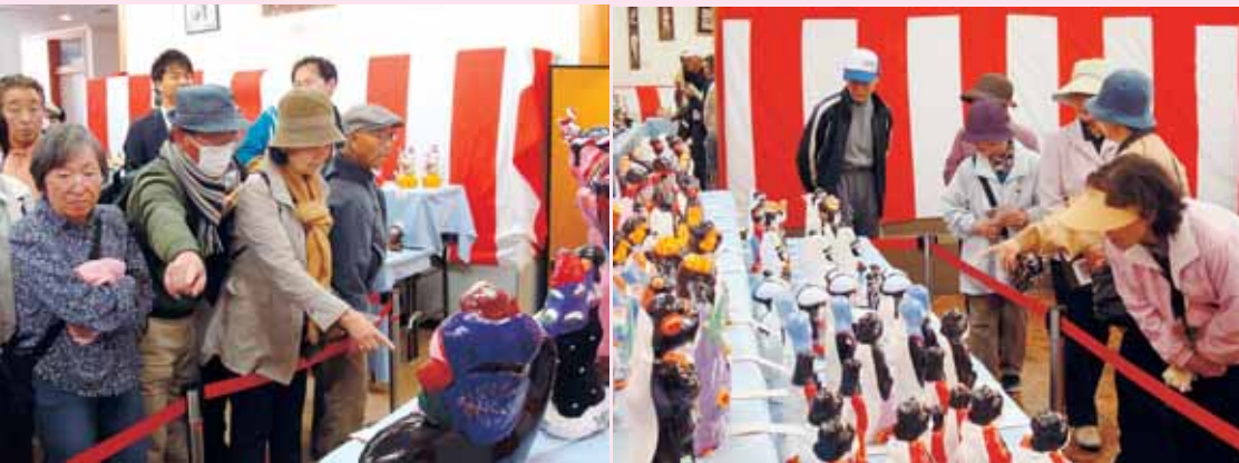
▲ 「踏み熊金太郎」と「土びな展示のようす」