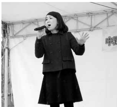
熱唱する麻衣さん

このほか、市街地の商店等73店の協力により3月1日から4月1日まで開催した「まちかど土びな展」には、パンフレットを持って歩く親子連れや観光客の姿がみられました。