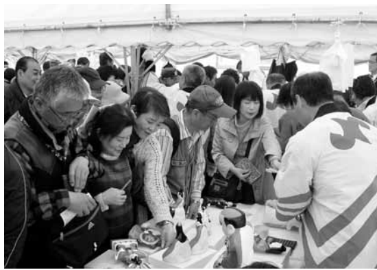
▶全国土人形即売会・即売開始直後のようす

31日夜は西町祭祀団による「大籠びな行進」が行われました。3基の大籠びなが「わっしょい」という大きな掛け声とともに市街地を行進し、ひな市の夜を華やかに彩りました。行進中、市街地の2ヶ所で行われた福まきも好評でした。