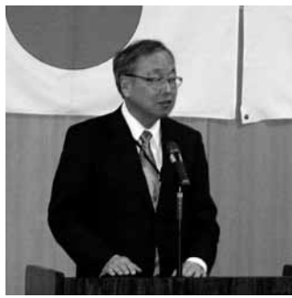
主催者式辞 池田中野市長