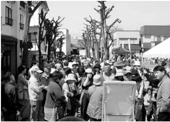
▶中野土びな抽選会に600人超並ぶ

「中野土びな展示即売会」は、今年から会場を商工会議所から中野陣屋・県庁記念館に変更して開催しました。土びなの展示は30日から始まり、1000人を超える方が会場に訪れ、お目当ての土びなを探したり、写真撮影をしたりと会場がごった返す賑わいでした。1日の即売会には年度末に関わらず、県内外から多くの土人形ファンが中野土びなを求めて訪れ、中町通りには600人を超える長蛇の列ができました。今年は、奈良家